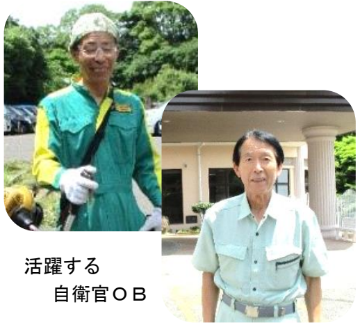
活躍する自衛官 O B

○その他 高齢者の自立支援という人から感謝される仕事です。大きな充実感を持つことが出来ます。経験豊富な職員が懇切丁寧に指導します。ので経験や資格がなくとも大丈夫です。